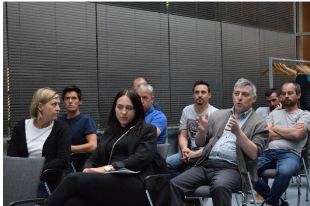
Die Investition in die Fachkräfte von morgen ist allen ein Anliegen und regt zur Diskussion an.

Danach machen sich die Ausbilder*innen in Kleingruppen auf, die Räumlichkeiten zu besichtigen. Vom Thinklab der Lehrlingsakademie geht es durch die Werkstatt zum Lager und Verkaufsbereich: